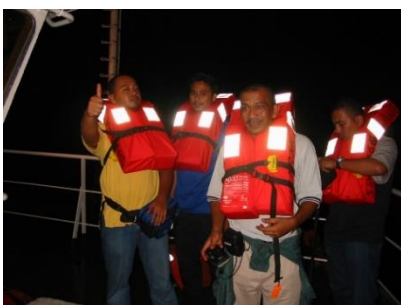
Gambarajah 1: Penumpang memakai Jacket Keselamatan (Lifejacket).