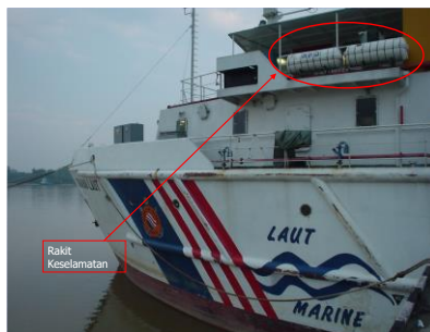
Gambarajah 2: Rakit Keselamatan atas kapal