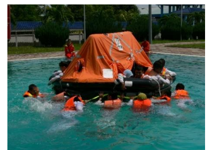
Gambarajah 3: Rakit Keselamatan untuk 25 orang yang telah dilancarkan